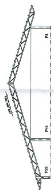
Corte BB escala 1:100