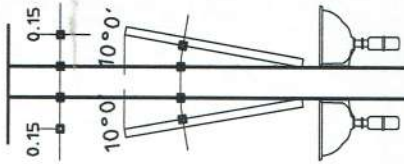
DET. INCLINAÇÃO ESPELHOS