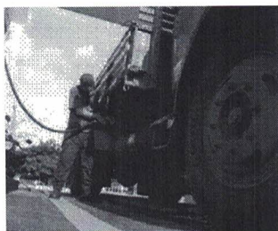
Caminhão durante abastecimento de diesel

A Petrobras anunciou hoje (14) um reajuste de 1,6% no preço do diesel e de 1,3% no preço da gasolina nas refinarias. Os novos valores vão vigorar a partir de amanhã (15).