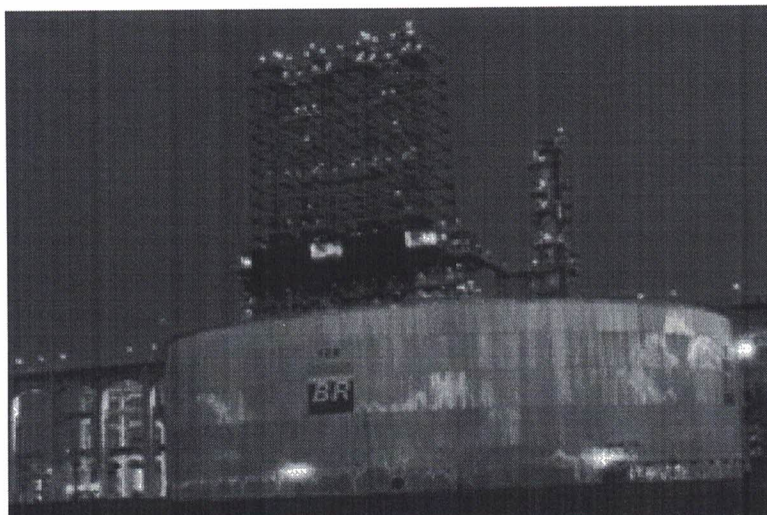
Petrobras reajustará amanhã o preço da gasolina em 4,2% nas refinarias de todo o país

Nielmar de Oliveira - Repórter da Agência Brasil